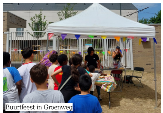
Buurtfeest in Groenweg

Gefeliciteerd aan alle geselecteerde projectdragers: verenigingen, collectieven en geëngageerde bewoners. Dankzij hen blijven de wijken van de Brusselse Woning zich ontwikkelen als echte leefplaatsen van solidariteit .