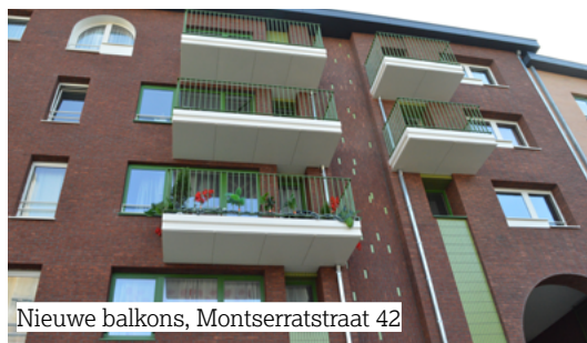
Nieuwe balkons, Montserratstraat 42

Met deze tweede afgewerkte werf werden meer dan 140 woningen gerenoveerd in het kader van ons Klimaatplan . Momenteel zijn er nog vier andere werven bezig in de Marollen en in Versailles.