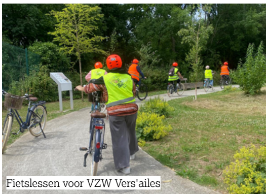
Fietslessen voor VZW Vers'ailes