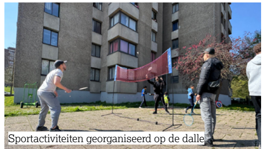
Sportactiviteiten georganiseerd op de dalle