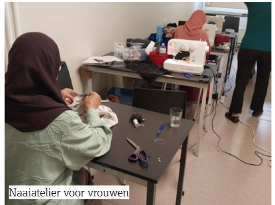
Naaiatelier voor vrouwen