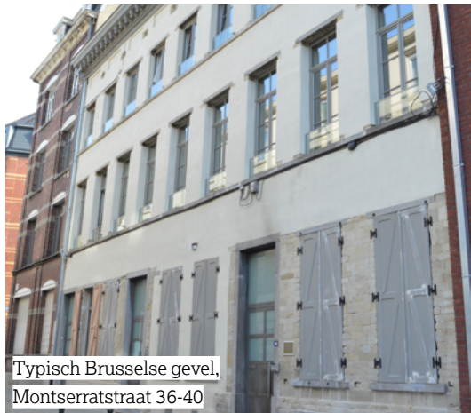
Typisch Brusselse gevel, Montserratstraat 36-40

De nieuwe gevelbekleding en de volumes met balkons geven deze straten een volledig nieuwe uitstraling. De typische Brusselse gevel van één van de gebouwen werd behouden en identiek gerestaureerd, na reiniging en isolatie.