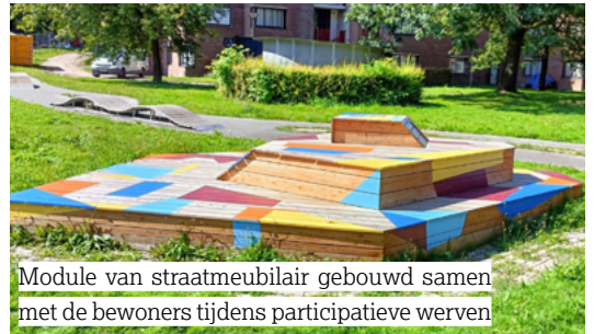
Module van straatmeubilair gebouwd samen met de bewoners tijdens participatieve werken

Zo werden vijf kleurrijke modules van straatmeubilair samen gebouwd. Dat laat toe om de wijk mee vorm te geven en aangenamer te maken.