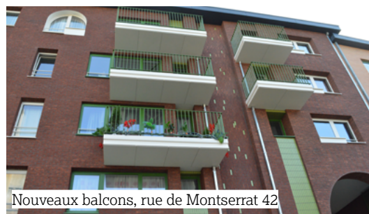
Nouveaux balcons, rue de Montserrat 42

Avec ce deuxième chantier achevé, ce sont plus de 140 logements qui ont été rénovés dans le cadre de notre Plan Climat . Actuellement quatre autres chantiers sont en cours dans les Marolles et à Versailles.