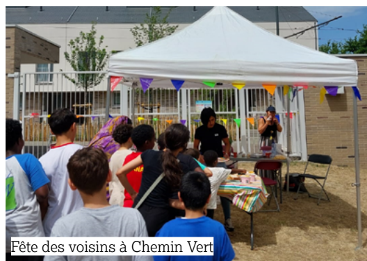
Fête des voisins à Chemin Vert

Félicitations à l'ensemble des porteurs de projets sélectionnés : associations, collectifs et habitants engagés. Grâce à eux, les quartiers du Logement Bruxellois continuent de se développer comme de véritables lieux de vie et de solidarité.