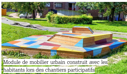
Module de mobilier urbain construit avec les habitants lors des chantiers participatifs

Le projet DAL ne se limite pas aux activités : les habitants peuvent aussi participer à l'aménagement du quartier grâce à des chantiers participatifs . Cinq modules de mobilier urbain coloré ont ainsi été construits collectivement. Un moyen concret de s'approprier son quartier et de le rendre plus agréable .