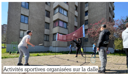
Activités sportives organisées sur la dalle