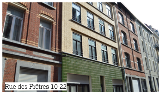
Rue des Prêtres 10-22