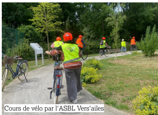
Cours de vélo par l'ASBL Vers'ailles