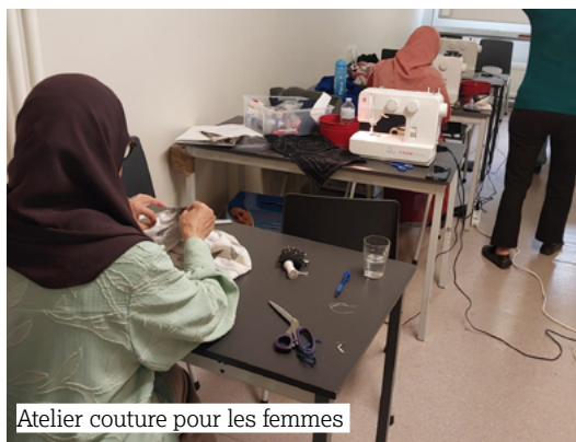
Atelier couture pour les femmes