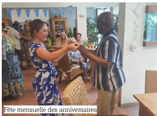
Fête mensuelle des anniversaires