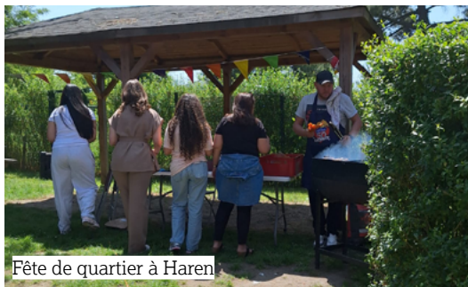
Fête de quartier à Haren