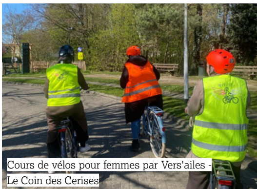
Cours de vélos pour femmes par Vers'ailes - Le Coin des Cerises

Si votre idée renforce le bien-être collectif, elle a donc toutes ses chances !