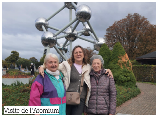
Visite de l'Atomium

Ces activités sont toujours adaptées aux centres d'intérêts et à l'énergie de chacun .