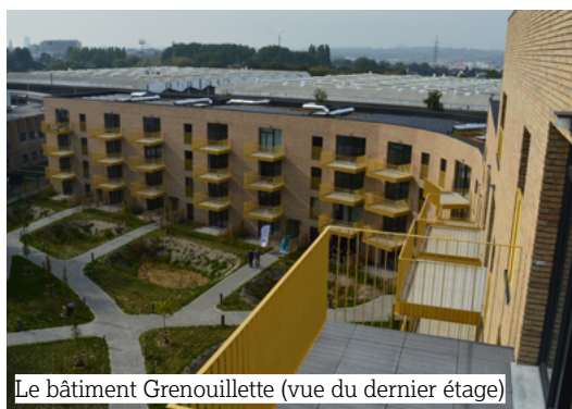
Le bâtiment Grenouillette (vue du dernier étage)

Nous souhaitons la bienvenue aux habitants : que ce nouveau cadre de vie soit synonyme de sérénité, de stabilité et de beaux projets.