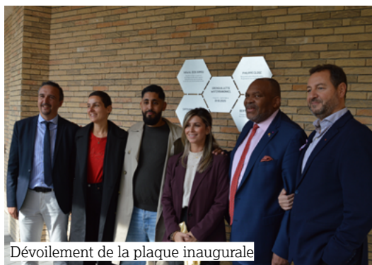
Dévoilement de la plaque inaugurale

Les locataires déjà installés ont également partagé ce moment dans une ambiance conviviale.