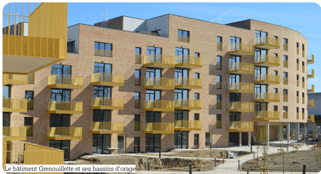
Le bâtiment Grenouillette et ses bassins d'orage