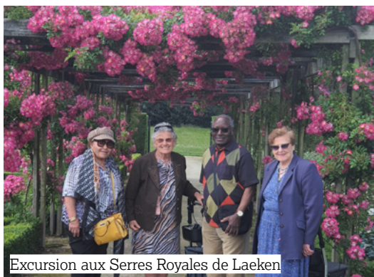
Excursion aux Serres Royales de Laeken

Une des spécificités de Versailles Seniors réside dans ses racines dans le secteur du logement social, permettant aux seniors les plus précarisés de bénéficier de services comparables à ceux offerts dans le secteur privé, à prix démocratiques .