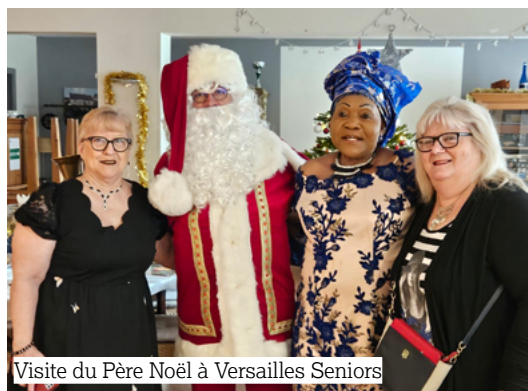
Visite du Père Noël à Versailles Seniors

Différents services et activités sont proposés comme, par exemple : aller au marché en groupe, aller faire ses courses en étant accompagné, entretien des logements,