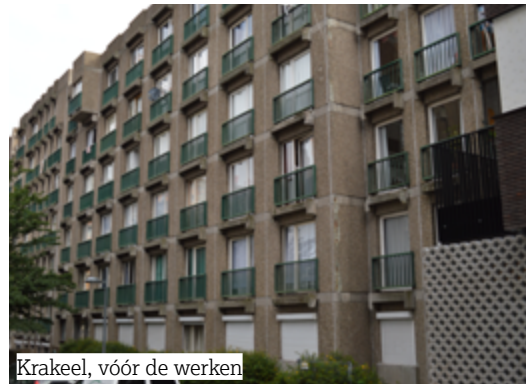
Krakeel, vóór de werken

Naast deze zichtbare verbeteringen, hebben er ook technische interventies plaatsgevonden om te zorgen voor een betere duurzaamheid van de gebouwen . De nieuwe installaties laten een beter beheer van de luchtstromen en de vochtigheid toe, wat de risico's van condensatie en schimmel vermindert. Deze modernisering zal zich dagelijks laten voelen in het comfort van de woningen!