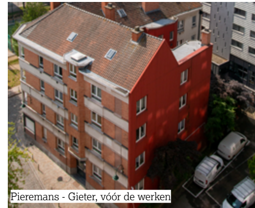
Pieremans - Gieter, vóór de werken