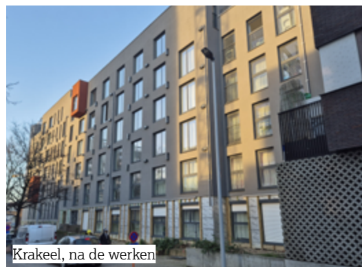
Krakeel, na de werken