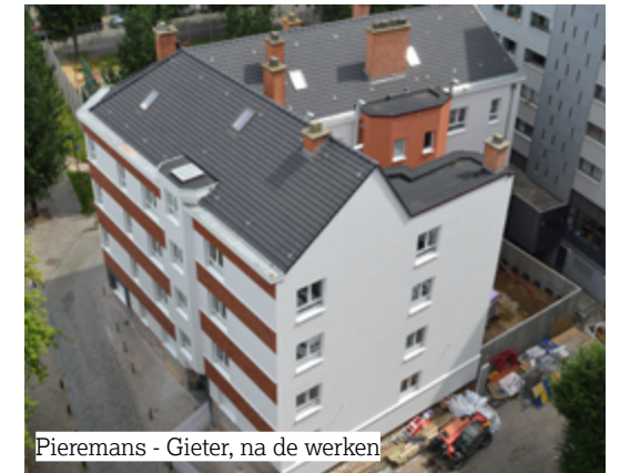
Pieremans - Gieter, na de werken