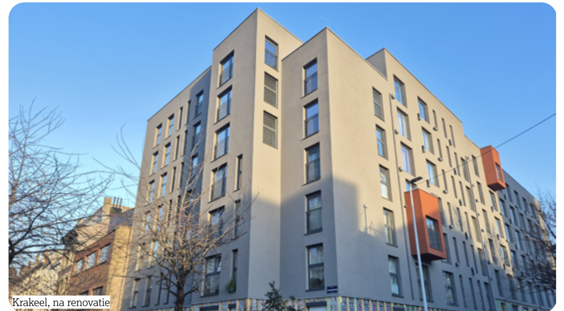
Krakeel, na renovatie