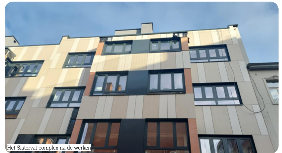
Het Sistervat-complex na de werken