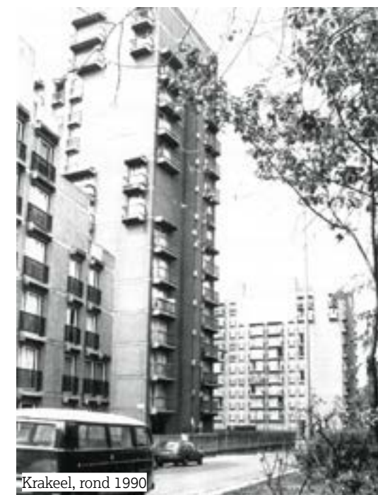
Krakeel, rond 1990