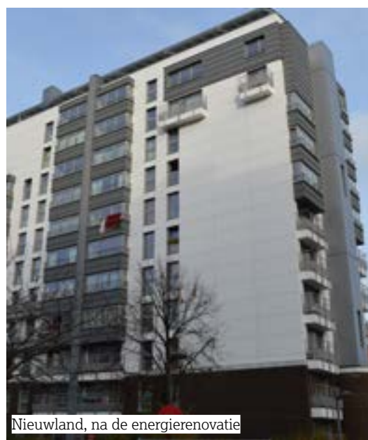
Nieuwland, na de energierenovatie