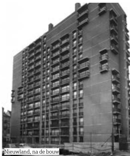
Nieuwland, na de bouw

Een deel van de woningen wordt rond het Krakeelplein gebouwd, dat de verbinding maakt met de Huidevettersstraat. Deze huizenblokbouw valt volledig uit de toon bij de toenmalige stedenbouw, die zich voornamelijk rond straatjes en stegen ontwikkelde.