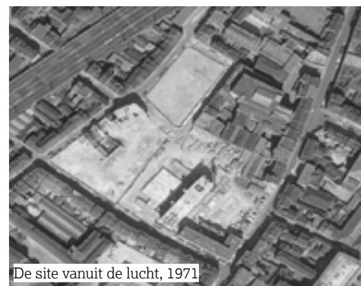
De site vanuit de lucht, 1971

Tot slot begint de Brusselse Woning dit jaar aan het laatste deel van de rehabilitatie van de wijk: de renovatie van de buitenschil van Krakeel 2-3 (131 woningen). De werken zouden over één jaar voltooid moeten zijn.