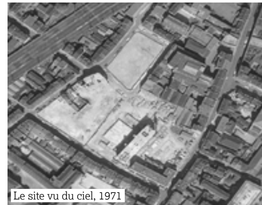
Le site vu du ciel, 1971

Enfin, en 2023, le Logement Bruxellois entame le dernier volet de réhabilitation du quartier : la rénovation d'enveloppe de Querelle 2-3 (131 logements). Les travaux devraient être terminés d'ici un an.