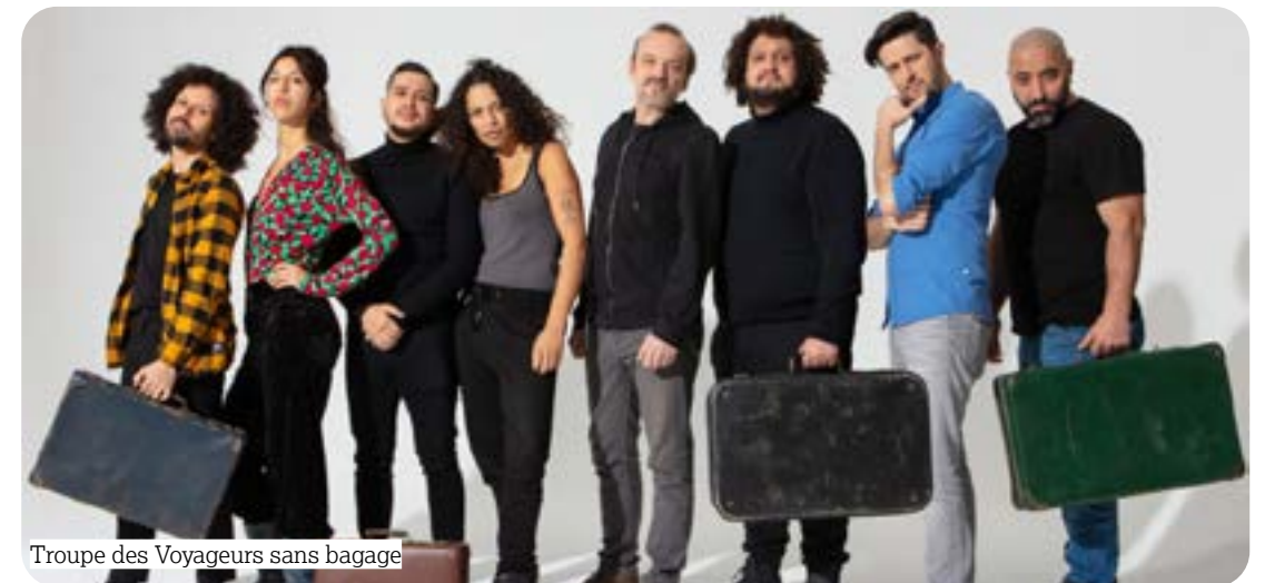
Troupe des Voyageurs sans bagage