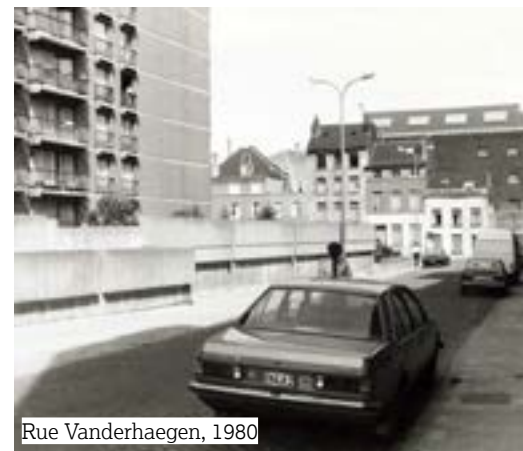
Rue Vanderhaegen, 1980