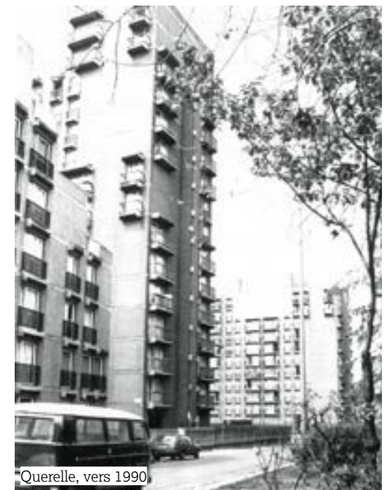
Querelle, vers 1990