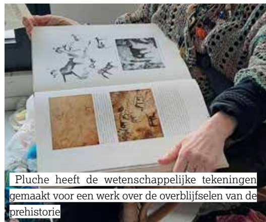
Pluche heeft de wetenschappelijke tekeningen gemaakt voor een werk over de overblijfselen van de prehistorie

Ik heb een fotografisch geheugen. Terwijl ik daar was, observeerde ik, ik onthield alles, en