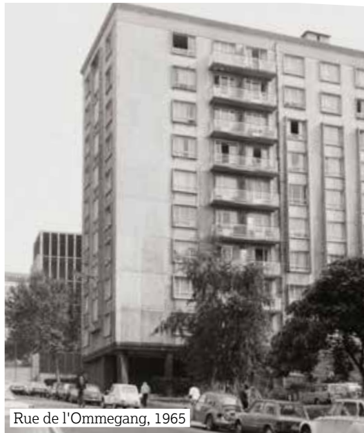
Rue de l'Ommegang, 1965

De financiën zijn een belangrijk punt voor de Nationale Maatschappij voor Goedkope Woningen, die het project mee financiert. Voor de bouw zullen de meest zuinige procedés worden toegepast. Enkel voor het gebouw 'Meiboom' zullen enkele verfraaiingen toegelaten zijn; dat zal een meer verzorgd uitzicht hebben gezien de onmiddellijke nabijheid van de nieuwe 'Verbindingslaan'.