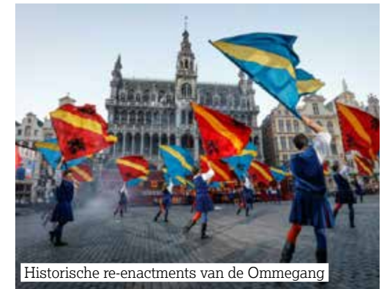
Historische re-enactments van de Ommegang