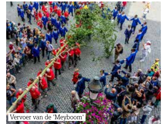
Vervoer van de 'Meyboom'