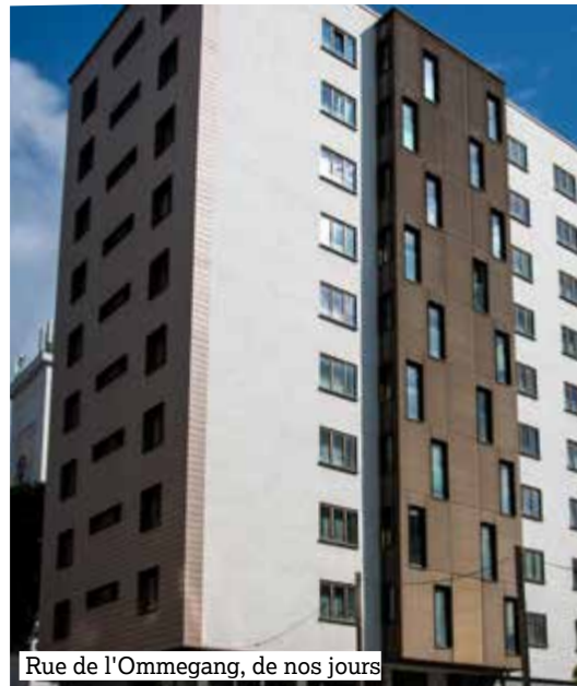
Rue de l'Ommegang, de nos jours

Voor de twee andere gebouwen, gelegen in de Broekstraat en de Ommegangstraat , zal de bouw van 1961 tot 1964 duren. Hierbij worden de principes toegepast die gelden voor sociale woningbouw in de jaren '60: torens gescheiden door een esplanade en zodanig georiënteerd dat er zo veel mogelijk zoninstraling is.