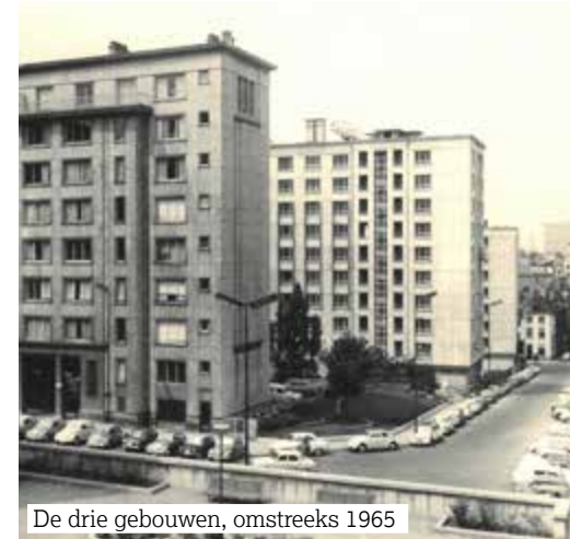
De drie gebouwen, omstreeks 1965

De drie gebouwen (204 appartementen) werden in 2019 gerenoveerd . Bij die werken werden de gebouwen geïsoleerd, werden er condensatieketels geïnstalleerd, kwamen er uitbreidingen voor de keukens en nieuwe terrassen.