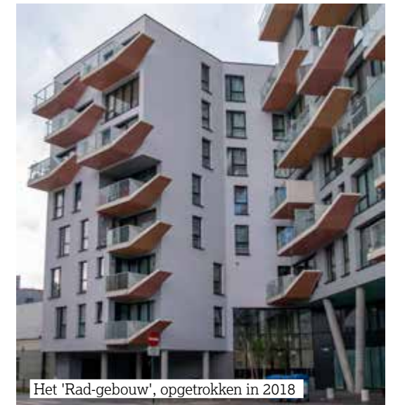
Het 'Rad-gebouw', opgetrokken in 2018