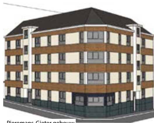
Pieremans-Gieter gebouw na de werven

de Brusselse Gewestelijke Huisvestingsmaatschappij (BGHM).