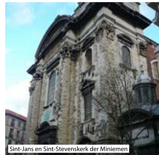
Sint-Jans en Sint-Stevenskerk der Miniemen

De straat dankt haar naam aan de religieuze orde der Minimien. Deze religieuzen uit Italië vestigen zich in de wijk in de jaren 1600.