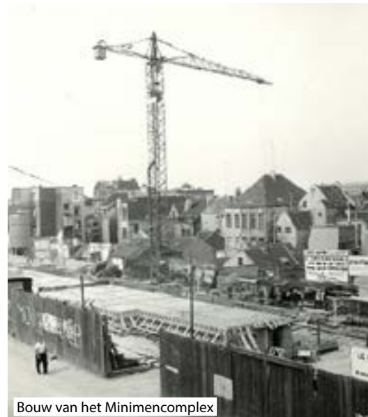
Bouw van het Minimencomplex

Bronnen : "Les Marolles", Marie-Hélène Genon Wikipedia.org