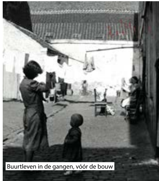
Buurtleven in de gangen, vóór de bouw

De gebouwen worden in twee fasen opgetrokken en de werken eindigen in 1962.