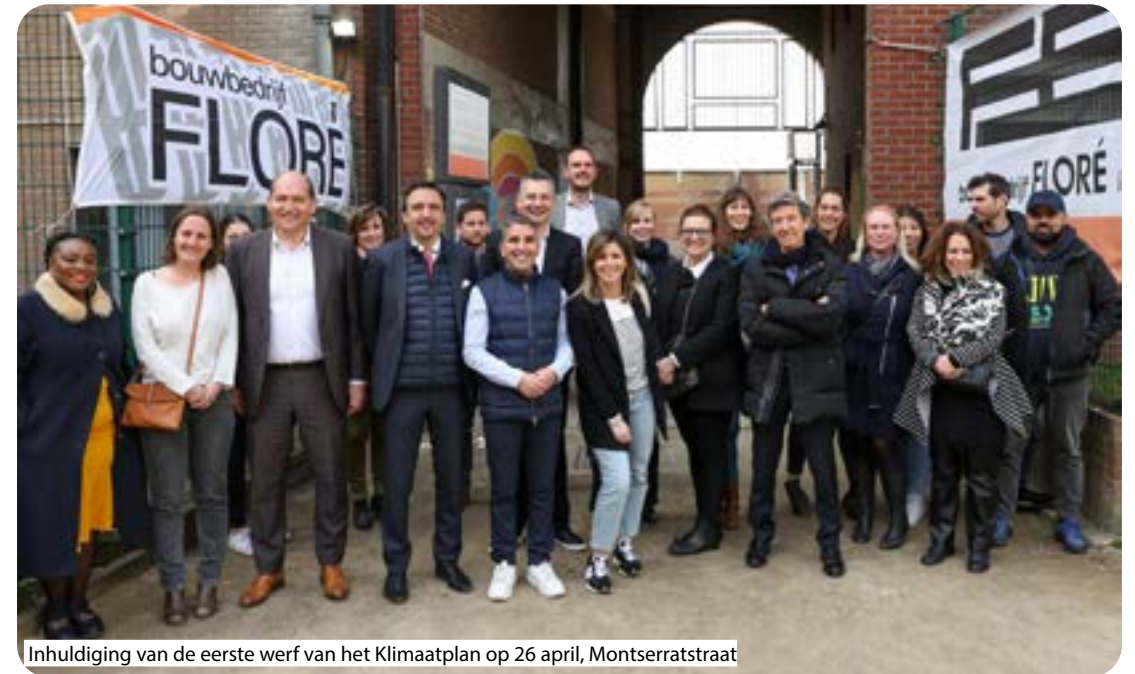
Inhuldiging van de eerste werf van het Klimaatplan op 26 april, Montserratstraat

Naast de klassieke communicatiekanalen (informatiesessies, affiches, website, elektronische mededelingenborden...), wordt de huurders een mobiele applicatie aangeboden. Ze stelt de aannemer die de werken uitvoert, de huurders en de huisvestingsmaatschappij met elkaar in verbinding en biedt functionaliteiten zoals het volgen van de fasen van de werken of het online maken van afspraken voor werken die in de woningen moeten worden uitgevoerd.