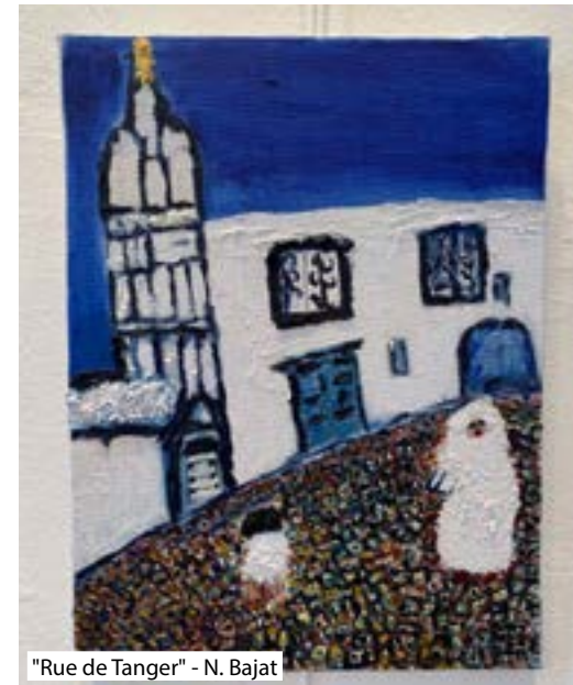
"Rue de Tanger" - N. Bajat

Ik ben hier aangekomen toen ik drie jaar was en de Brusselaars hebben ons verwelkomd. Het zijn mijn vrienden, mijn familie. Als ik naar de oude "brusseleirs" kijk, dan vind ik hun situatie onrechtvaardig. Ze klagen niet, maar zijn soms echt behoeftig en ze zijn eenzaam.