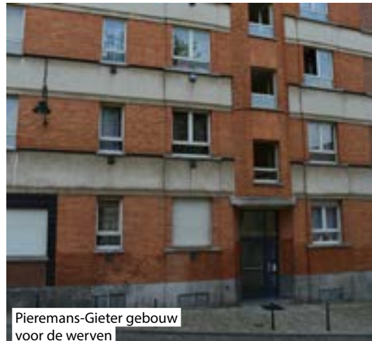
Pieremans-Gieter gebouw voor de werven

Dit "Klimaatplan" zal toelaten om talrijke woonsites te renoveren en te isoleren, dankzij de investeringen van de Stad Brussel en