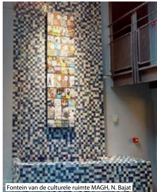
Fontein van de culturele ruimte MAGH, N. Bajat