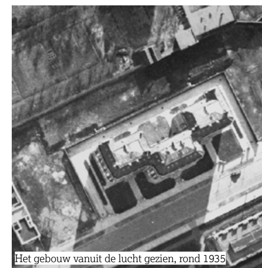
Het gebouw vanuit de lucht gezien, rond 1935