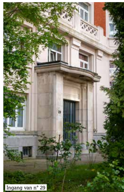
Ingang van n° 29

De Antoine Depagelaan dankt haar naam aan de chirurg en senator , geboren in 1862 en overleden in 1925.