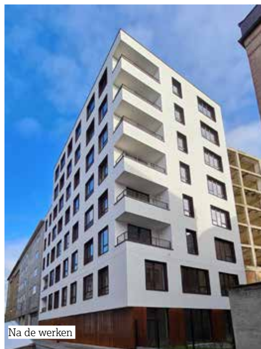
Na de werken