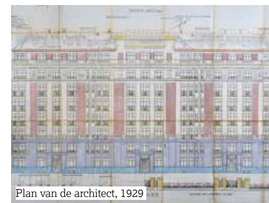
Plan van de architect, 1929

Hij werd tot lijfarts van de koning benoemd, en is ook Voorzitter van het Rode Kruis van België geweest en heeft het Rode Kruis van Congo opgericht.