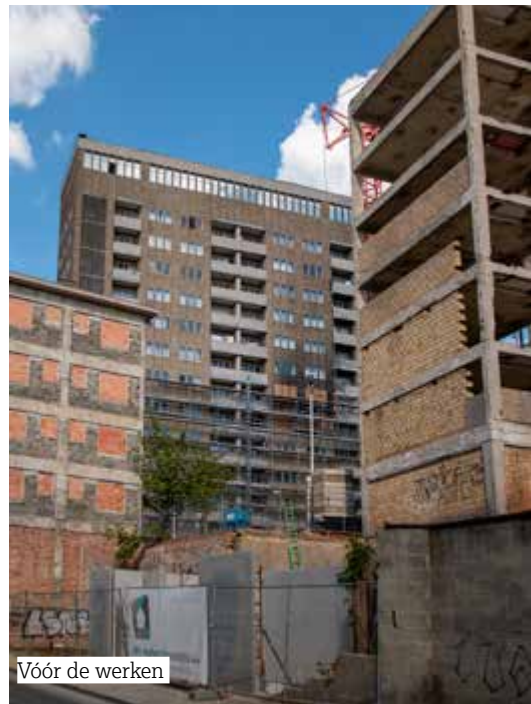
Vóór de werken

Ingeplant in een ruimte waar sluikstorten van huishoudelijk en grof afval vroeger schering en inslag was, vult dit nieuwe gebouw het hoogteverschil op tussen de Menslievendheidsstraat (op verdieping 0) en de Hoogstraat (verdieping 2). Het is toegankelijk via twee ingangen in elk van deze twee straten. Het integreert zich in de wijk van de Hoogstraat, die in volle verandering is met talrijke recente en toekomstige renovaties.