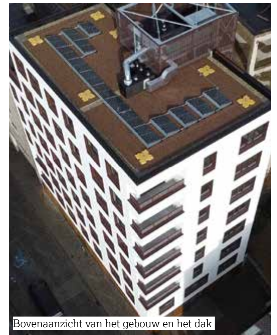
Bovenaanzicht van het gebouw en het dak