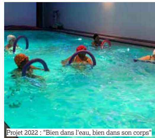
Projet 2022 : "Bien dans l'eau, bien dans son corps"

Vous avez jusqu'au 31 janvier pour envoyer votre proposition de projet via le formulaire (reçu par courrier) au service social du Logement Bruxellois.