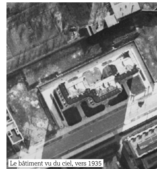
Le bâtiment vu du ciel, vers 1935