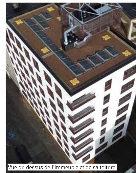
Vue du dessus de l'immeuble et de sa toiture