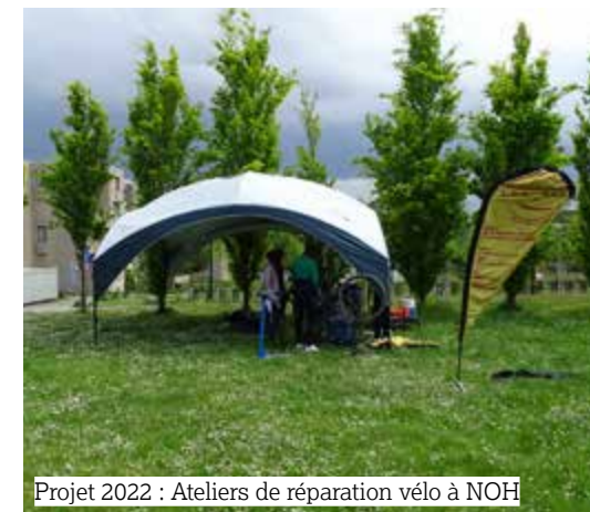
Projet 2022 : Ateliers de réparation vélo à NOH