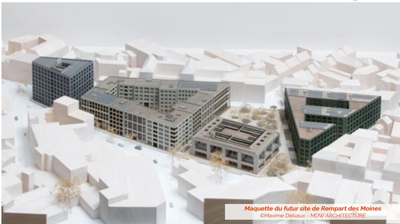
Maquette du futur site de Rempart des Moines ©Maxime Delvaux - MDW ARCHITECTURE