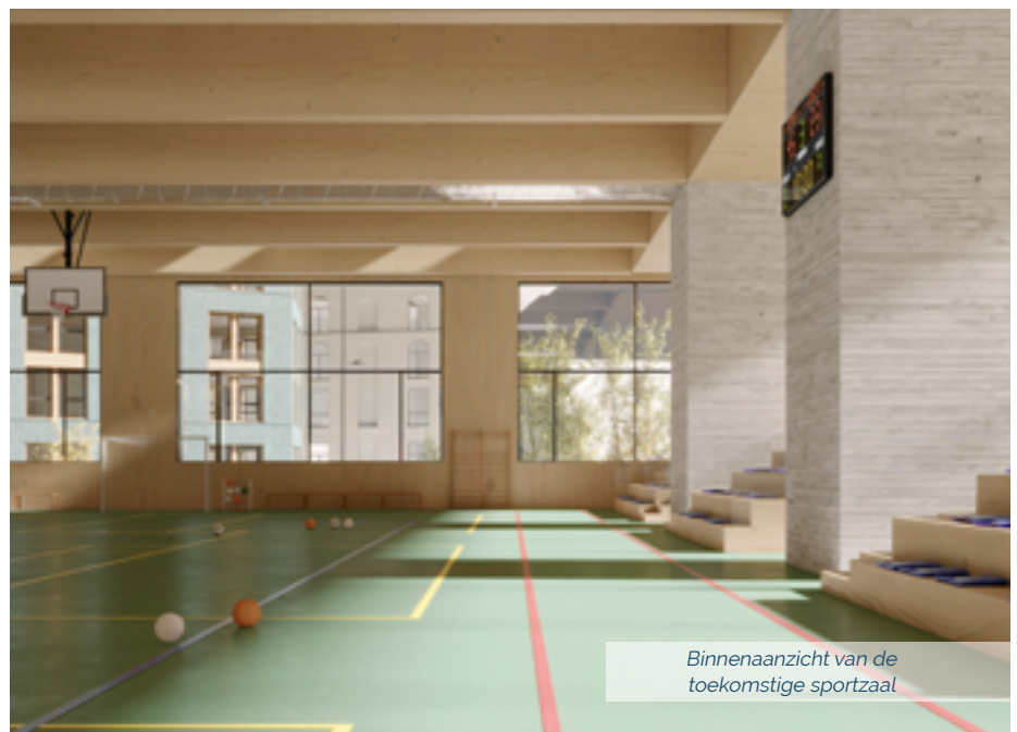
Binnenaanzicht van de toekomstige sportzaal

We hebben net fitnessmaterieel aangekocht: roeitoestellen, elektrische fietsen... om het sportaanbod van de zaal nog verder te diversifiëren.