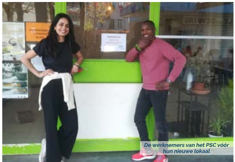
De werknemers van het PSC vóór hun nieuwe lokaal

Ja, dat klopt. We zijn nu geïnstalleerd in de Grootsermentstraat 16. De configuratie is net hetzelfde als in het vroegere lokaal, maar dit lokaal werd gerenoveerd, wat zeer aangenaam is voor het team en voor de bewoners die ons een bezoekje komen brengen.