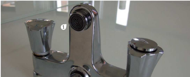
Robinet contenant un mousseur (1).

Le mousseur est un accessoire situé sous la tête du robinet qui évite les éclaboussures et retient les microparticules en suspension dans l'eau. S'il fuit au niveau de sa jonction avec le bec, c'est que le joint est défectueux. Dans ce cas, le joint usagé en caoutchouc doit être remplacé par un neuf. Lorsque l'eau coule en tous sens ou qu'il n'en sort qu'un filet, c'est souvent dû à un dépôt de tartre ou de calcaire qui obstrue le tamis contenu dans le mousseur. Vous pouvez dans ce cas le nettoyer pour qu'il fonctionne à nouveau correctement.